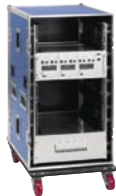
Electronic-Case für 4 x 19" EVG

Superklemme, MA-035 L2.76985.0 Sicherheitsseil mit Karabiner L2.76990.0 Sicherheitssteil, klein L2.76809.0