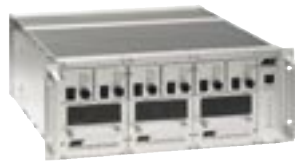
EB 575 EVENT SIX

EB 575 EVENT SINGLE, L2.76259EV EB 575 EVENT SIX, 19" L2.76340.0 EB 200/575/1200 Multifunktion L2.76777.0