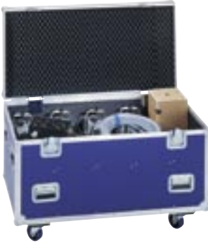
Transportkoffer für 9 x Event 2