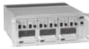
EB 200/575/1200 MULTIFUNKTION

EB 200/575/1200 Multifunktion L2.76777.0