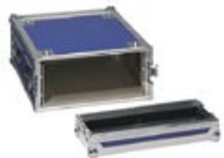
Flightcase für 1 x 19" EVG