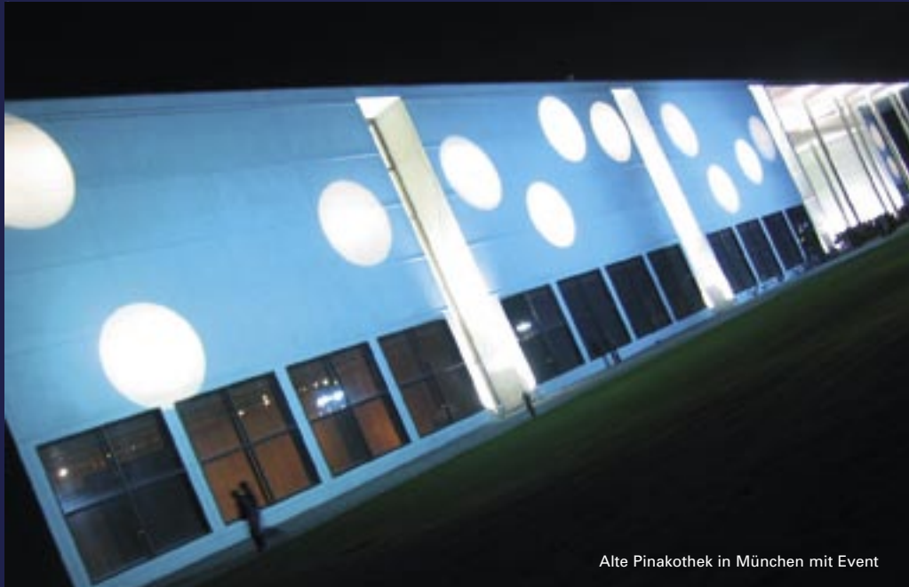
Alte Pinakothek in München mit Event