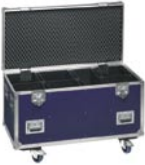
Transportkoffer für 6 x Event 2/5