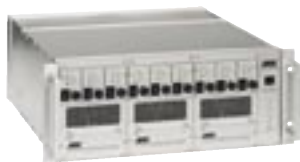
EB 200 EVENT NINE

EB 200 EVENT NINE, 19" L2.76308.0 EB 200/575/1200 Multifunktion L2.76777.0