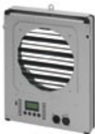
Rückseite SH-5 Event Jalousie

Kabel DMX-P-0,5m L2.80868.0 Kabel DMX-P-01 m L2.80868.1 Kabel DMX-P-02 m L2.80868.2 Kabel DMX-P-03 m L2.80868.3 Kabel DMX-P-04 m L2.80868.4 Kabel DMX-P-05 m L2.80868.5 Kabel DMX-P-06 m L2.80868.6 Kabel DMX-P-07 m L2.80868.7 Kabel DMX-P-12 m L2.80868.12 Kabel DMX-P-15 m L2.80868.15