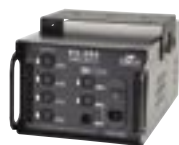
Netzgerät PS-204 in Standardausführung