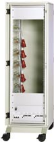
Schaltschrank für 8 x 19" EVG