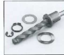
L4.79370.E Focus spindle Fokusspindel