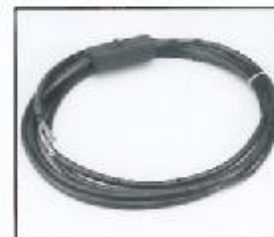
L4.79476.E Mains cable without plug Netzkabel ohne Stecker