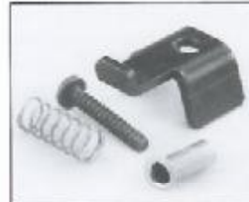
L4.79365.E Top latch Torsicherung