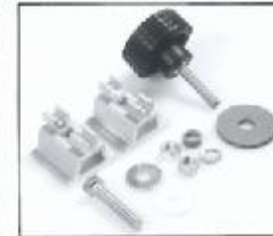
L4.79378.E Mounting set for stirrup Bügelbefestigungssatz