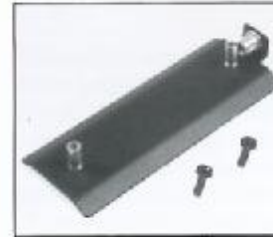
L4.79364.E Cover Abdeckblech