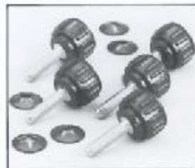
L4.79357.E Knurled-head screw 5 pieces Rändelschrauben-Satz 5 Stück