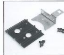
L4.79384.E Lamp carriage Fassungsträger GX 6,35