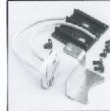
L4.79372.E Lamp holder + lamp carriage Lampenfassung + Fassungsträger GX 6,3