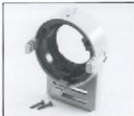
L4.79362.E Front casting Frontteil