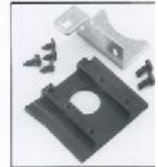
L4.79403.E Lamp carriage Fassungsträger B 15 d 120