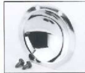
L4.79386.E Reflector Reflektor