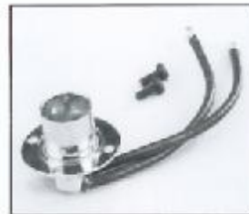
L4.79443.E Lamp holder Lampenfassung B 15 d 120V