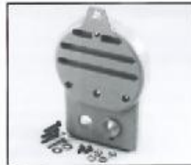
L4.79366.E Rear casting Rückteil