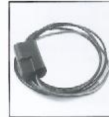
L4.79439.E Mains cable with dimmer Netzkabel mit Dimmer