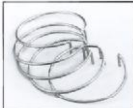
L4.79369.E Retaining ring 5 pieces Haltering 5 Stück