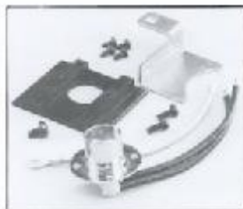
L4.79373.E Lamp holder + lamp carriage Lampenfassung + Fassungsträger B 15 d 120V