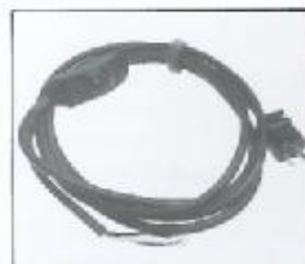
L4.79442.E Mains cable Netzkabel/USA