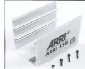
L4.79367UE Bottom part ETL Unterteil ETL