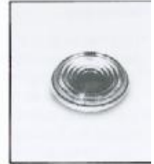
L4.72885.E Fresnel lens Stufenlinse