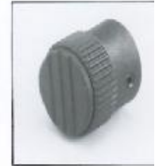
L4.79379.E Focus knob Fokusknopf