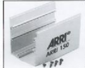
L4.79367.E Bottom part Unterteil