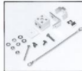
L4.79388UE Terminal block ceramic Kabelklemme Keramik