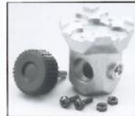
L4.79358.E 16 mm stirrup socket Hülse für Bügel