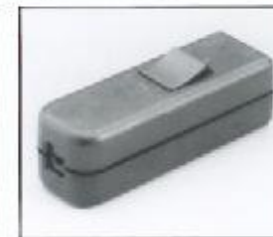
L4.79477.E Inline switch only Schnurschalter