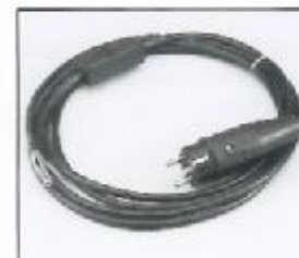
L4.79444.E Mains cable with Schuko plug Netzkabel mit Schuko Stecker