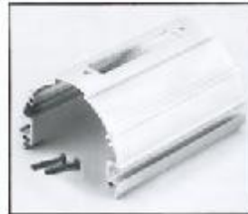
L4.79363.E Extrusion, top Rippenblech, oben