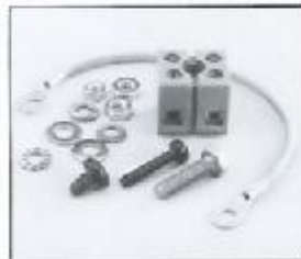
L4.79388.E Terminal block plastic Kabelklemme Kunststoff