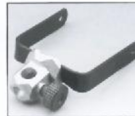
L4.79375.E Stirrup complete Haltebügel komplett