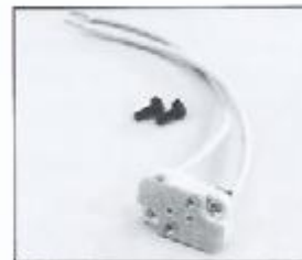
L4.79377.E Lamp holder Lampenfassung GX 6,35