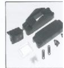
L4.77157UE Inline switch only USA Schnurschalter USA